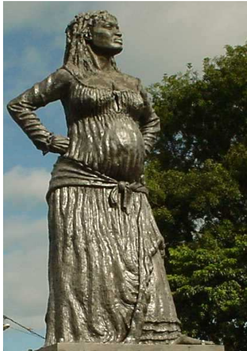
Statue dressée à la mémoire de Solitude au carrefour de Lacroix, au Boulevard des Héros à la ville des Abymes (Guadeloupe).

De la manière la plus démocratique qu'il soit, dans notre pays et depuis fort longtemps, Solitude et de nombreuses autres figures illustres de notre Histoire, font l'objet de multiples manifestations de la plus sincère & éternelle reconnaissance du peuple et du patrimoine qu'ils lui ont laissé. Les commémorations nombreuses, qui ont cours chaque année au mois de Mai dans les Antilles françaises, en témoignent.